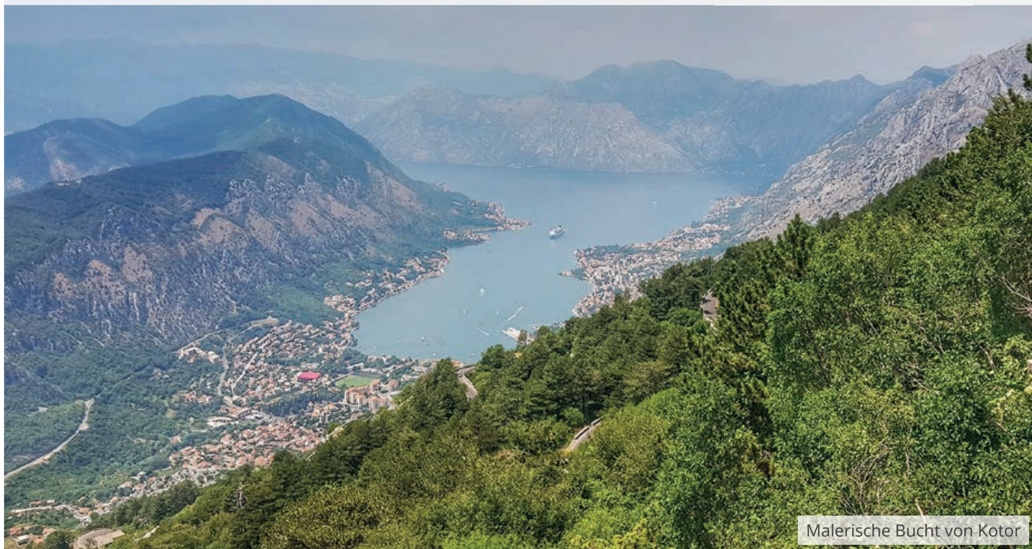
Malerische Bucht von Kotor