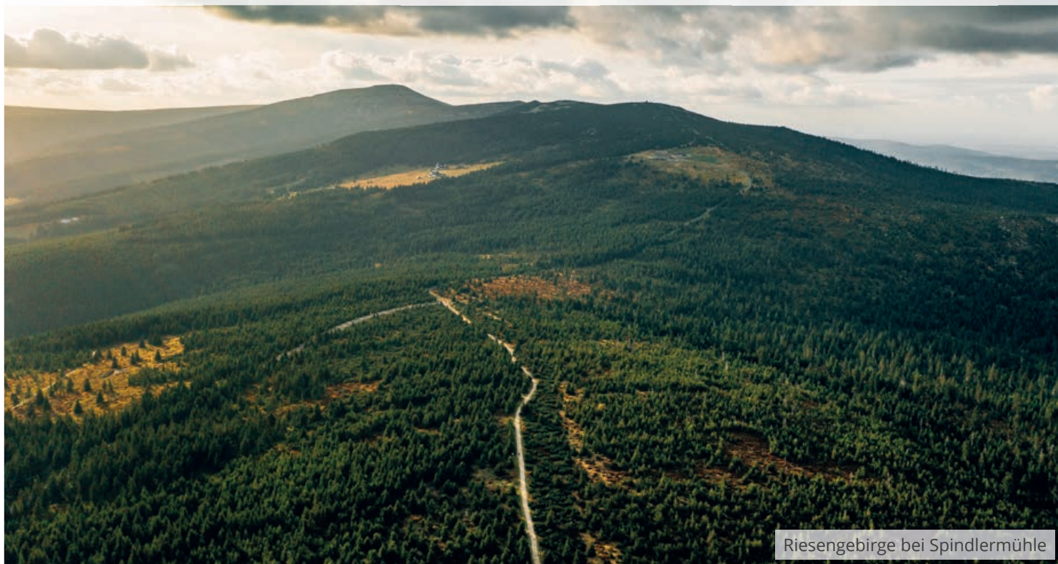
Riesengebirge bei Spindlermühle