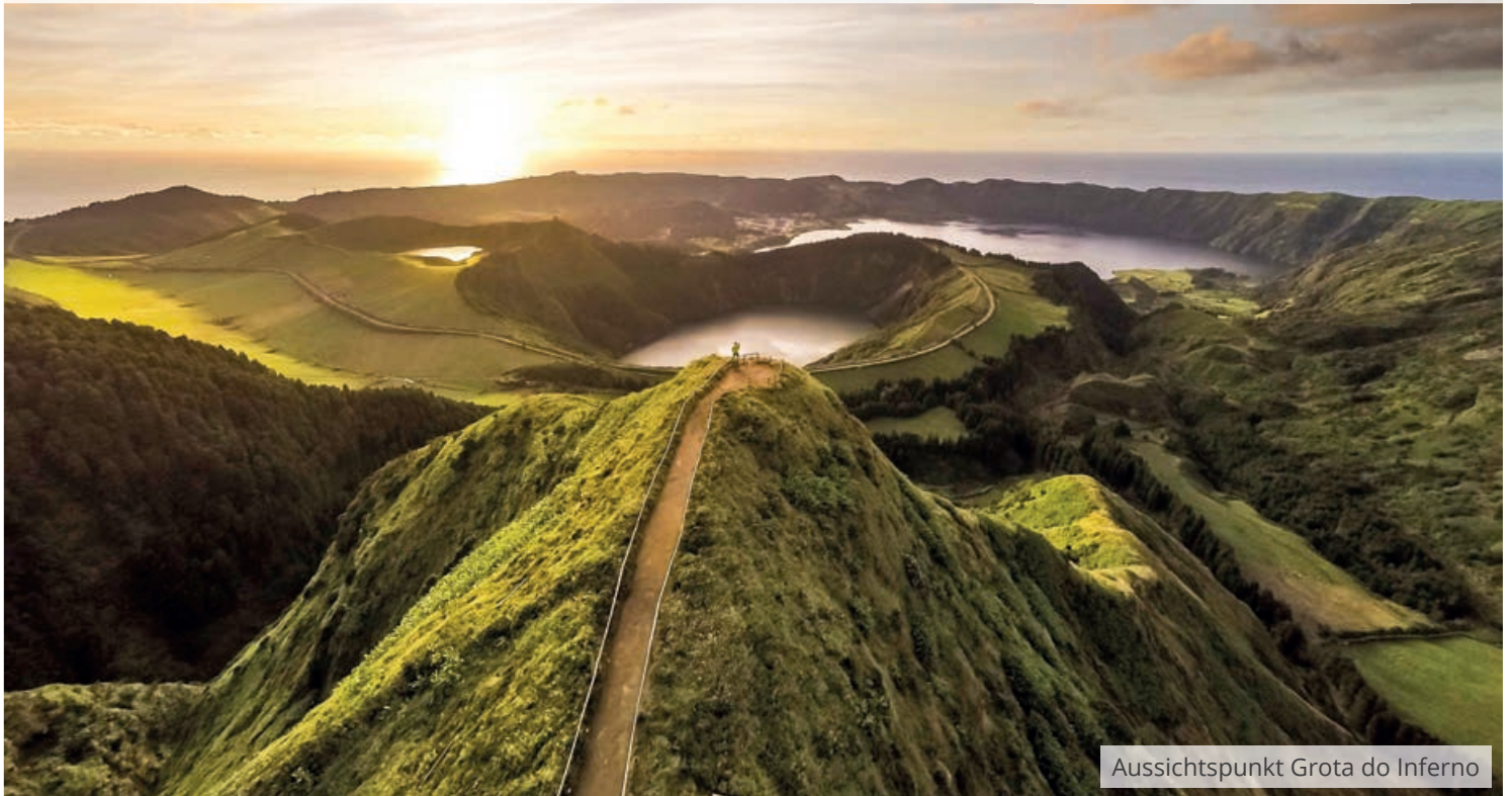
Aussichtspunkt Grota do Inferno