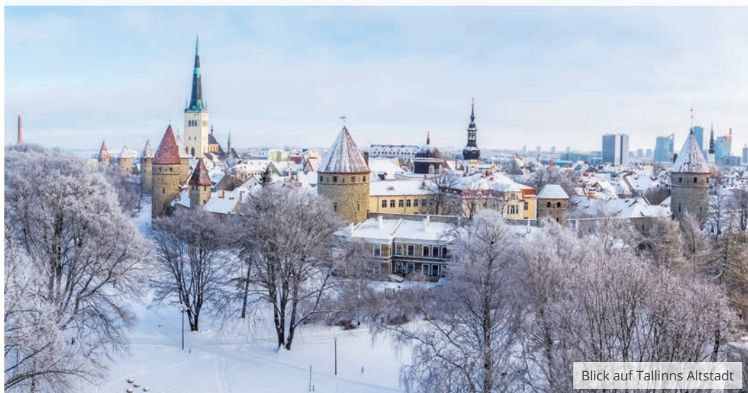
Blick auf Tallinns Altstadt

5 TAGE | AB 1.195,- € | 🧑‍🤝‍🧑 10 BIS 20 GÄSTE | ✈️ INKL. FLUG