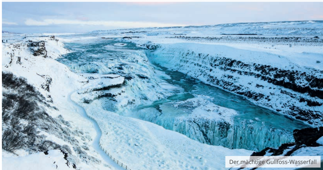
Der mächtige Gullfoss-Wasserfall

8 TAGE | AB 2.395,- € | 🧑‍🤝‍🧑 1 BIS 14 GÄSTE | ✈️ INKL. FLUG