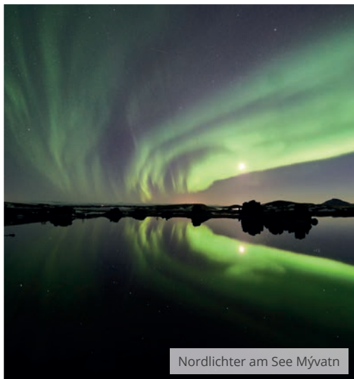
Nordlichter am See Mývatn