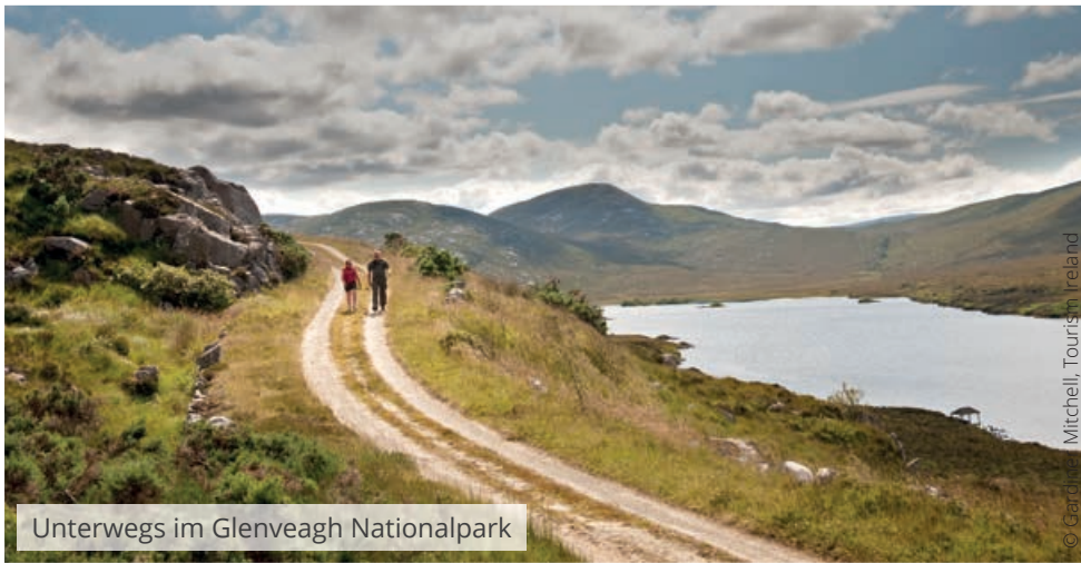
Unterwegs im Glenveagh Nationalpark