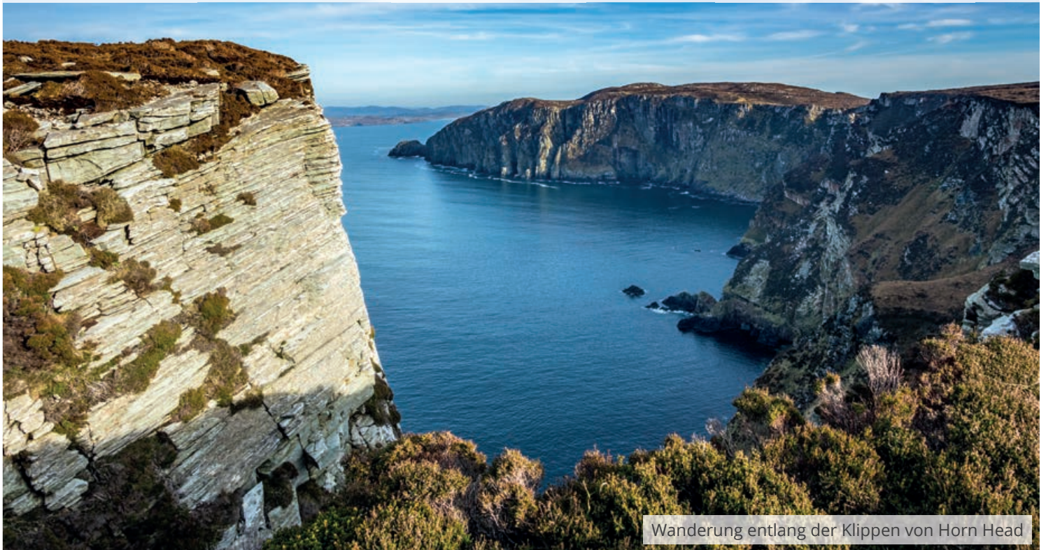
Wanderung entlang der Klippen von Horn Head