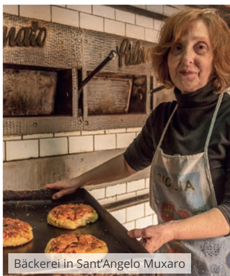
Bäckerei in Sant'Angelo Muxaro

"Italien ohne Sizilien macht gar kein Bild in der Seele. Hier ist erst der Schlüssel zu allem" – das wusste schon Johann Wolfgang von Goethe. Sizilien ist die größte Insel des Mittelmeeres und zeugt von einer geschichtsträchtigen Vergangenheit. Griechen, Römer, Karthager, Araber, Normannen, Staufern, Spanier und Österreicher bewohnten die Insel bereits.