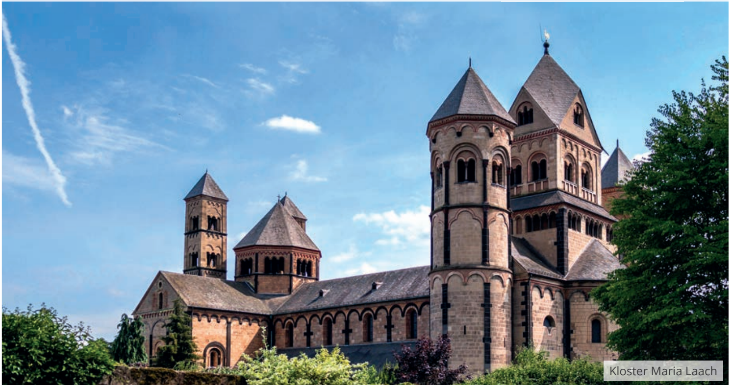
Kloster Maria Laach