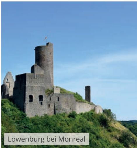
Löwenburg bei Monreal