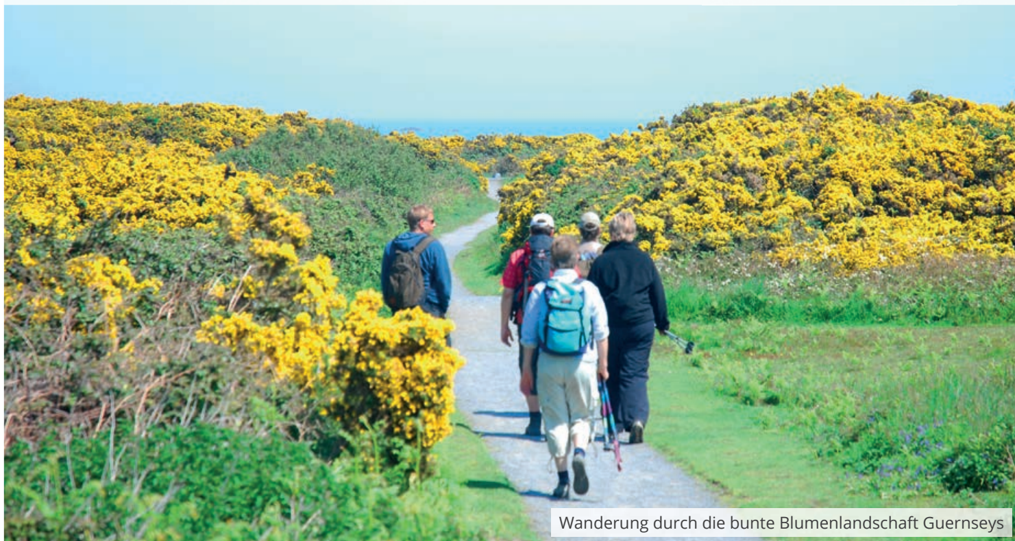
Wanderung durch die bunte Blumenlandschaft Guernseys