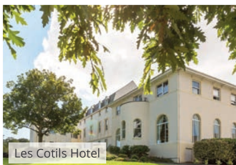
Les Cotils Hotel

G uernsey ist die zweitgrößte Insel der Kanalinseln und lockt Besucher aus der ganzen Welt mit malerischen kleinen Orten, zerklüfteten Küsten, langen Sandstränden und sanften Hügeln.