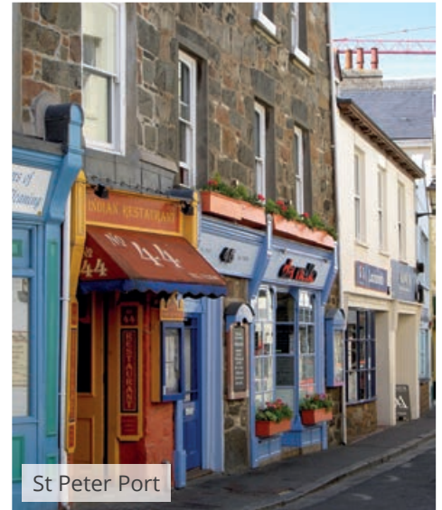
St Peter Port