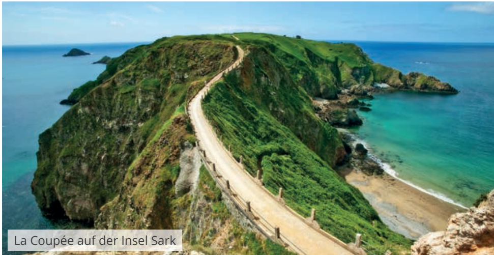
La Coupée auf der Insel Sark