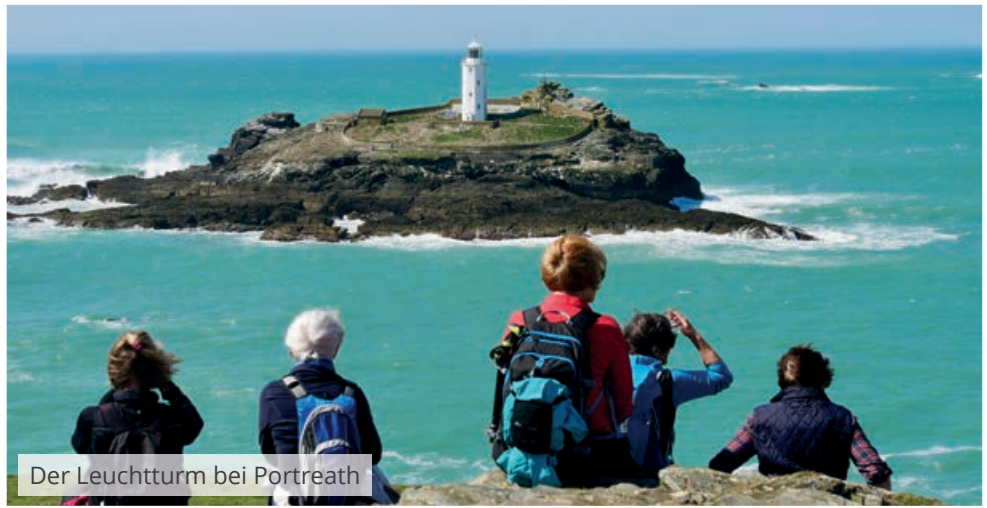
Der Leuchtturm bei Portreath