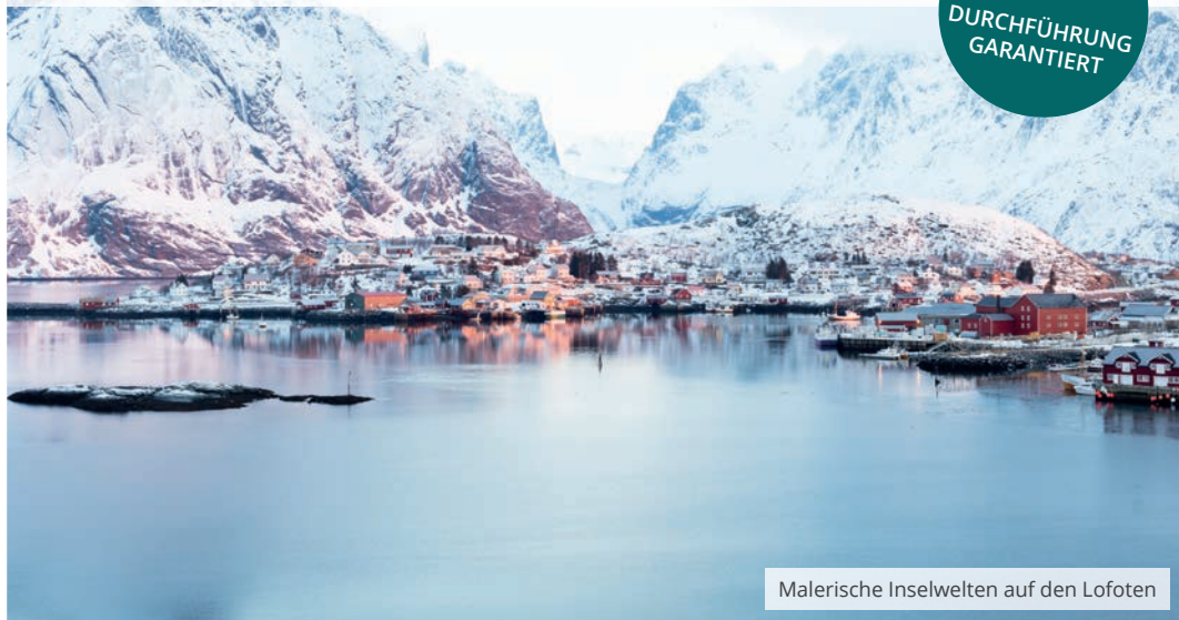
Malerische Inselwelten auf den Lofoten