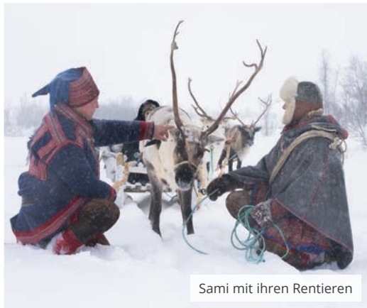
Sami mit ihren Rentieren