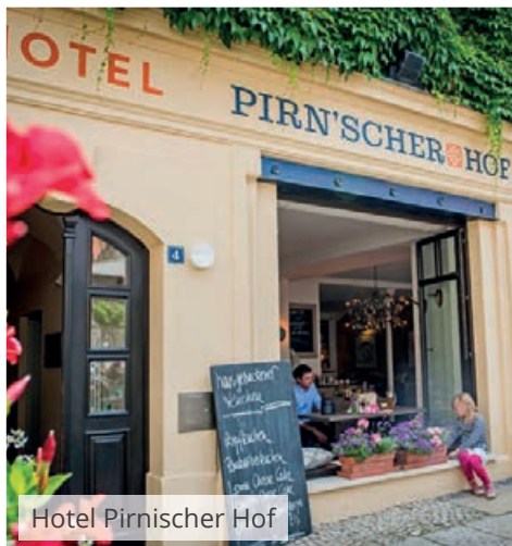
Hotel Pirnischer Hof

Nach dem Wandern können wir uns im Geibeltbad Pirna oder der Toskana Therme Bad Schandau entspannen.