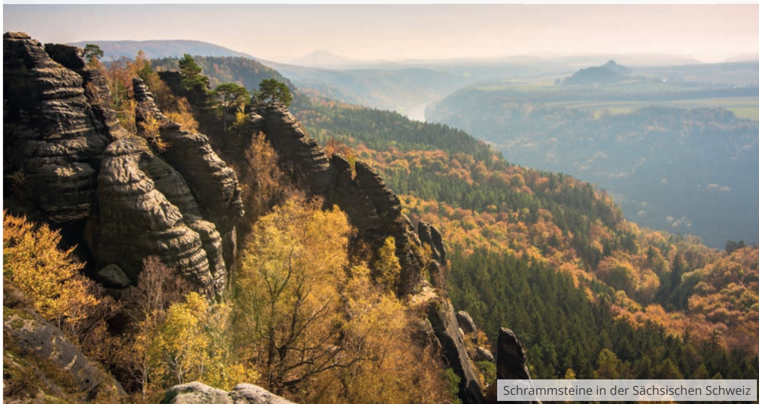
Schrammsteine in der Sächsischen Schweiz