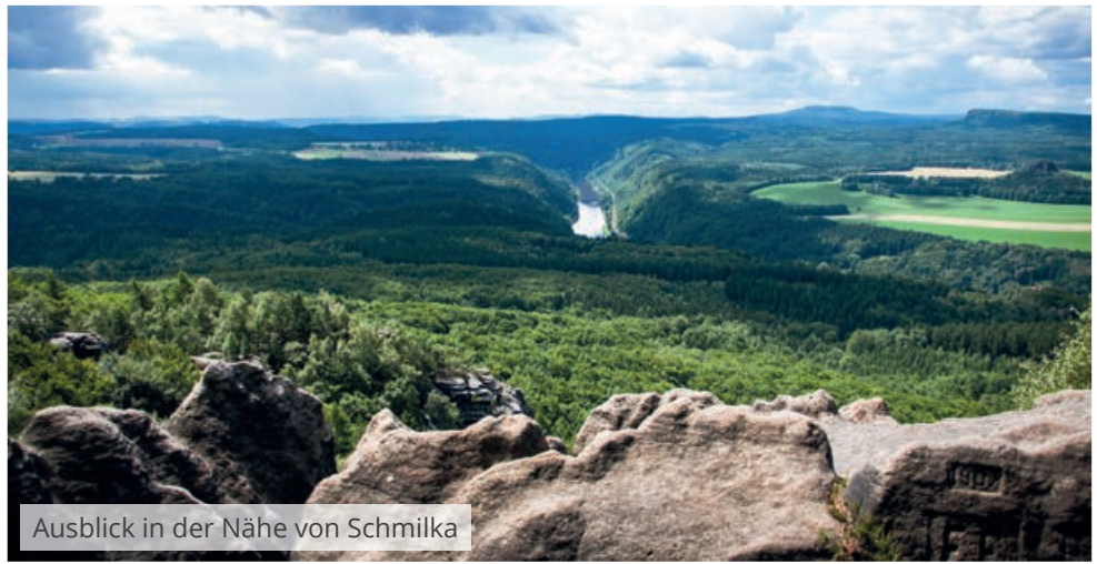
Ausblick in der Nähe von Schmilka