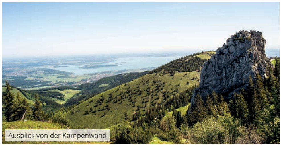
Ausblick von der Kampenwand