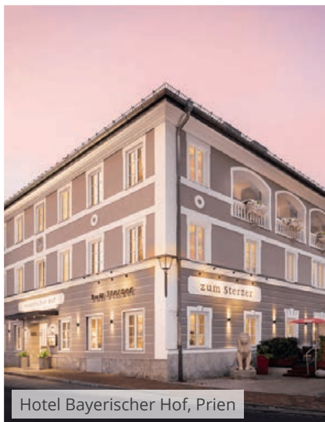
Hotel Bayerischer Hof, Prien

Der Chiemgau ist eine wunderschöne Kulturlandschaft in Oberbayern. Entstanden durch die Eiszeit, ist die Region hauptsächlich durch ihre hügelige Landschaft mit zahlreichen Wiesen- und Moorflächen geprägt.