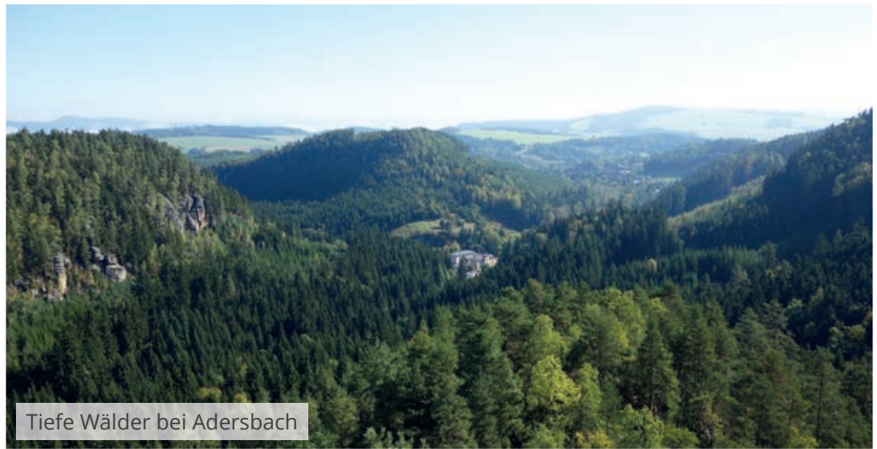
Tiefe Wälder bei Adersbach