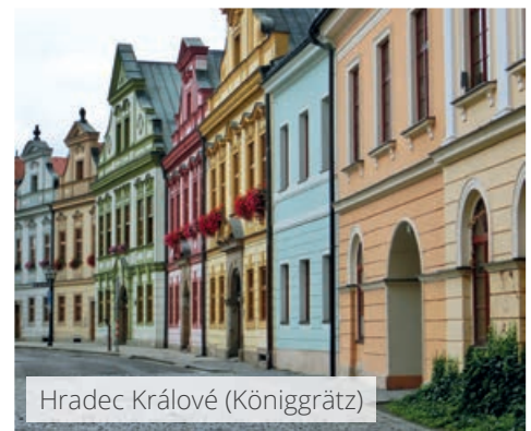
Hradec Králové (Königgrätz)

Jetzt auf www.highlaender.de/CZ8-BSW und in Ihrem Reisebüro : Detailverlauf, Buchung & Infos – auch für Alleinreisende im halben Zweibettzimmer!