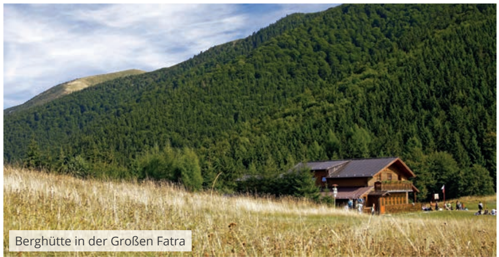
Berghütte in der Großen Fatra