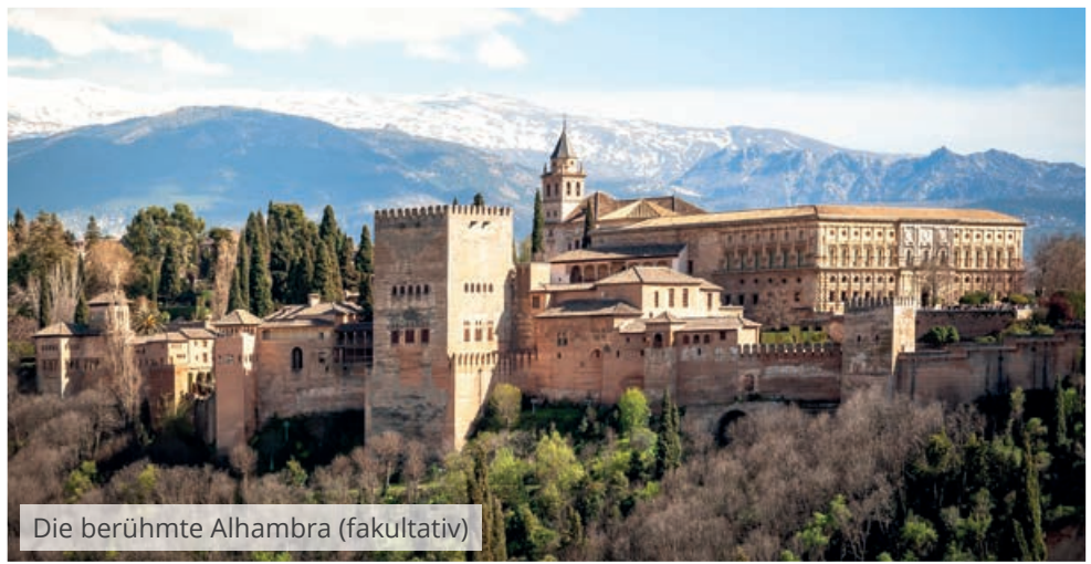
Die berühmte Alhambra (fakultativ)